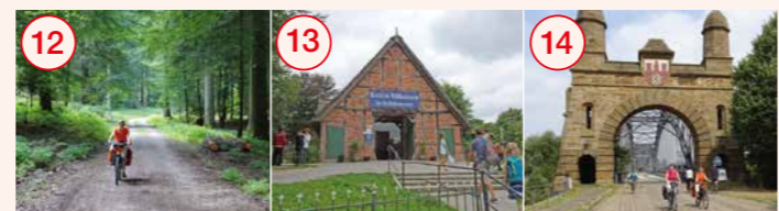
12 Rosengarten: Staatsforst mit Karlstein und Findlingslehrpfad „Groß-Modder-Eiche“ 13 Ehestorf: Freilichtmuseum am Kiekeberg und Wildpark Schwarze Berge 14 Harburg: Alte Harburger Elbbrücke