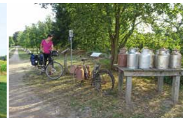
Milchbank in Heidenau