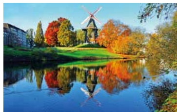
Bremer Mühle am Wall