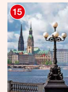
15 Hamburg: Elbe mit Hafens, Speicherstadt, Auswanderermuseum „BallinStadt“, Landungsbrücken, Elbphilharmonie, Hafencity und Fischmarkt, Alster mit Rathaus, Jungfernstieg und diverse Shopping-Passagen sowie die „Kunstmeile Hamburg“, deren fünf renommierte Häuser in fußläufiger Entfernung zum Entdecken einladen.