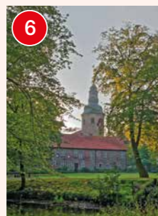
6 Zeven: Museum Kloster Zeven, Königin-Christinen-Haus, St. Viti Kirche, Gauß-Zimmer, Feuerwehrmuseum, Fußgängerzone mit zeitgenössischen Kunstobjekten, Familienbad Aquafit und Naturbad Zeven