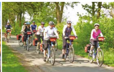
Mit Freunden unterwegs