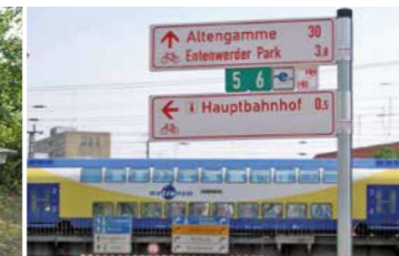
Mit dem Metronom zurück nach Hause