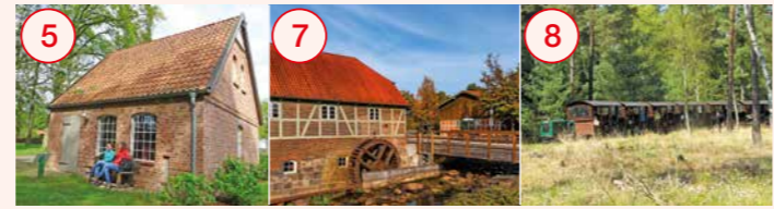
5 Nartum: Literaturnachmittage im Haus Kreienhoop, Motormühle und Nartumer Großsteingrab 7 Sittensen: Wassermühle mit Handwerksmuseum, Heimathausgelände, St. Dionysius-Kirche 8 Tiste: Tister Bauernmoor mit Moorbahn und Mooreerlebniszone, Beobachtungsturm und Aussichtsplattform