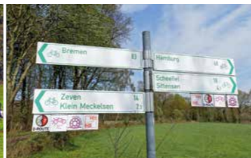
Hier geht es lang