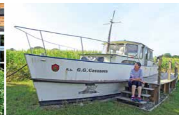
Nartumer Hafen ganz im Grünen