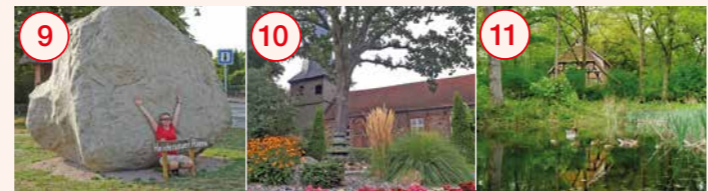
9 Heidenau: Zwei historische Ortskerne, Findling „Heidenauer Riese“ und Hochzeitswald, Freibad im Feriencenter Heidenau 10 Hollenstedt: Backsteinkirche St. Andreas, Burgwall Hollenstedt 11 Appel: Appelbecker Fischteiche