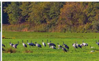
Kraniche rasten zur Vogelzugzeit im Frühjahr und Herbst an der Route