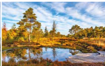
Entspannung pur im Tister Bauernmoor