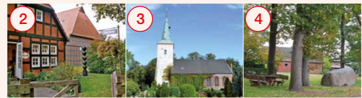
2 Fischerhude: Historisches Künstlerdorf, Otto Modersohn Museum, Heimathaus Irmintraut und Butmanns Hof 3 Wilstedt: St. Petri-Kirche, Milchkontor (berühmteste Eisdiele Niedersachsens 2020) 4 Vorwerk: Vorwerker Steinriesen mit Rastplatz