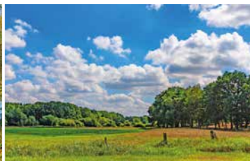
Stressfreies Radeln durch tolle Landschaften