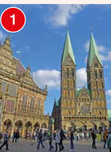
1 Bremen: UNESCO-Welterbe Rathaus und Roland, Marktplatz mit St. Petri Dom, Bremer Stadtmusikanten, Böttcherstraße, Schnoorviertel, Weserpromenade Schlachte, Kunsthalle, Übersee-Museum, Universum, botanika im Rhododendronpark, Überseestadt, uvm.