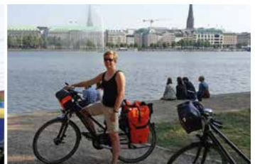
Hamburgs Binnenalster, ein lohnendes Ziel