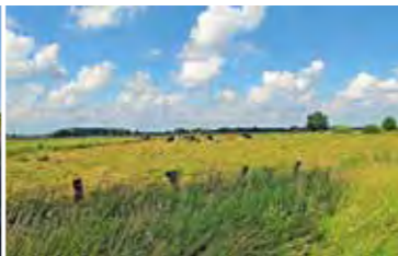
Weite Wümmelandschaft unter Wolkenhimmel