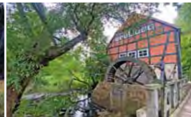
Die Wümme an der Wassermühle Stuckenborstel