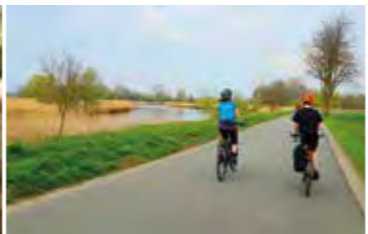
Radeln mit Wümmeblick im Blockland