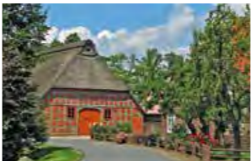
Typisch norddeutsch - die mit Reet gedeckten Fachwerkhäuser