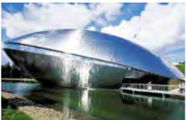
Ein Abstecher zum Bremer Universum