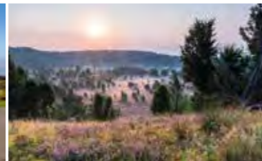
Der Totengrund bei Bispingen