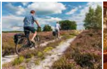
In der Heide gibt es sandige Abschnitte