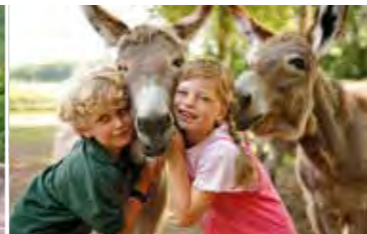
Tierisches Vergnügen im LandPark Lauenbrück