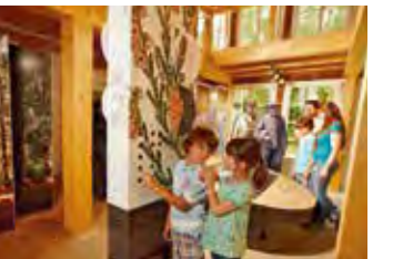
Der Natur auf der Spur im Heide-ErlebnisZentrum in Undeloh