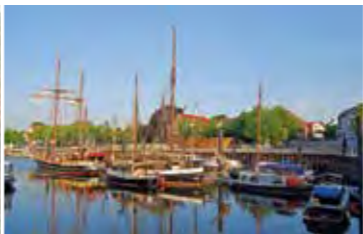
Entdecken des kleinen Vegesacker Museumshavens