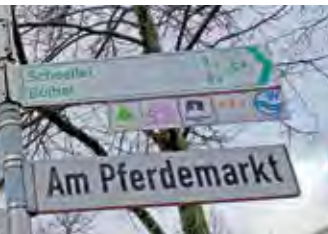
Hier geht es lang

Bremer Touristik-Zentrale GmbH Findorffstraße 105 28215 Bremen Tel.: 0421 3080010 btz@bremen-tourism.de www.bremen-tourismus.de