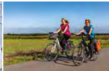
Auf nach Bremen