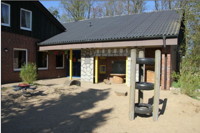
Kita Asendorf II.jpg