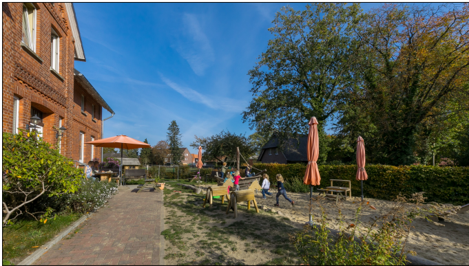
Kinderhaus Birkenlund - Spielplatz

Betreuungsangebote: altersübergreifende Gruppe (1-6 Jahre)