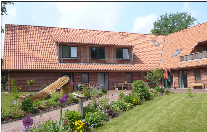
Leben in ländlicher Idylle - Wohnheim Wennerstorf für Menschen mit Behinderung

Leben und arbeiten in einem idyllischen Dorf; Im Wohnheim Wennerstorf gibt es in familiärer Atmosphäre 13 Wohnplätze für Menschen mit Behinderung.